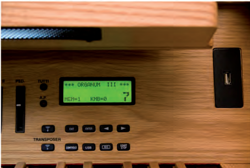
USB-Anschluss und grafisches Display