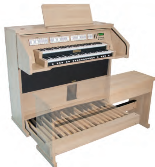
Praeludium III in Laminat hell

Durch die anschlagdynamischen Klaviaturen kann die Artikulation der Töne reichhaltig und positiv beeinflusst werden, wie bei einer mechanischen Pfeifenorgeltraktur.