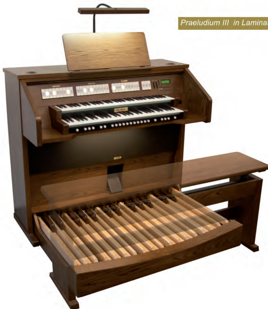
Praeludium III in Laminat dunkel

Die Besonderheit dieser Orgel ist die Individualität, denn die 24 Register können aus der vorhandenen Registerdatenbank jederzeit geändert werden. Über das menügeführte Bedienfeld mit 4-zeiligem Display ist unter anderem eine einfache Einzeltonintonation jedes Registers möglich. Aus der Datenbank können für jedes Register, Klangfarben gleicher Familie geladen werden. So erhält die Orgel einen völlig neuen Klangcharakter, ganz nach Ihrem Geschmack oder für verschiedene Musik-Stilrichtungen und Orgelbau-epochen.