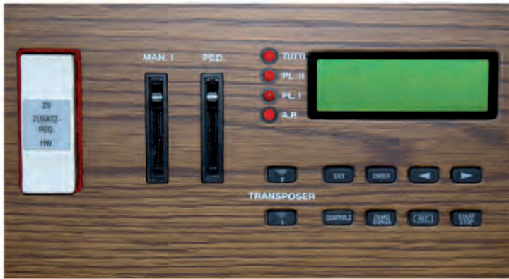
Zusatzregister mit Display Anzeigen für Festregister und Automatisches Pedal